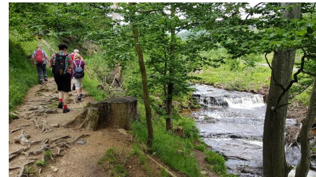
Wanderpfad an der Ilse