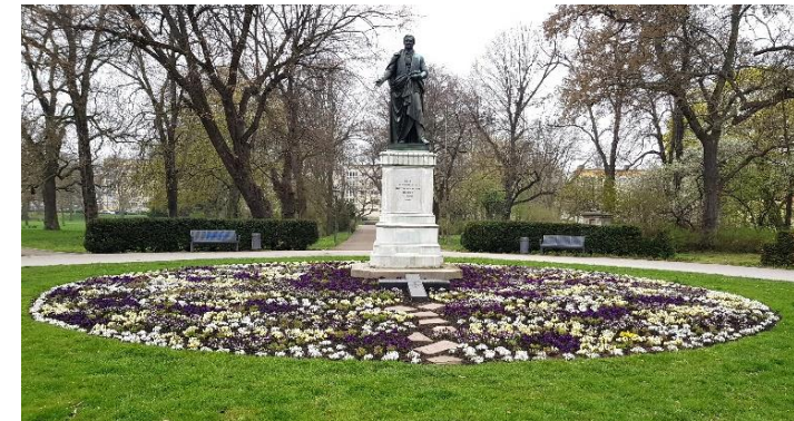
Denkmal des früheren Oberbürgermeisters August Wilhelm Francke